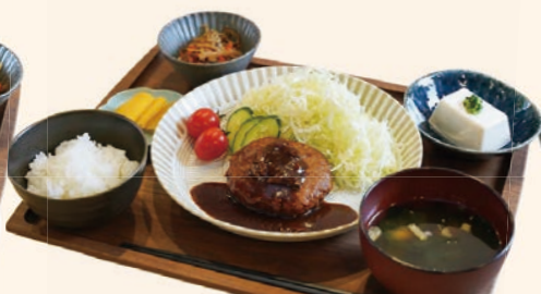
デミグラスハンバーグ定食