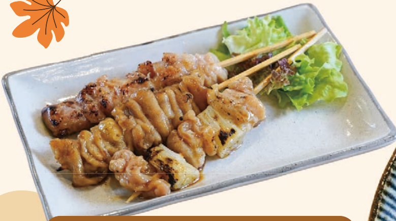
焼き鳥3本セット 500円