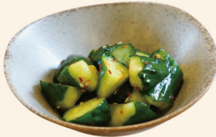
ピリ辛きゅうり 350円